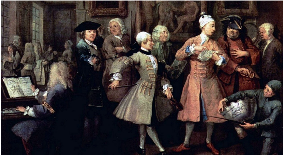
من أزياء الرجال في أوروبا في القرن الميلادي ١٨

ولم تتبدل هذه الصورة كثيرا في بداية العصور الوسيطة الأوروبية حتى العصر الغوطي، حيث بدأت تتكون طبقة اجتماعية متوسطة من التجار والمهنيين، وأصدرت الطبقة الحاكمة من النبلاء ورجال الكنيسة سلسلة من القوانين التي تمنع أنواعا معينة من الألبسة عن الطبقة الجديدة، ولكن دون جدوى، فلم تعد ألبستها مقتصرة على القمصان والفساتين البسيطة المظهر.