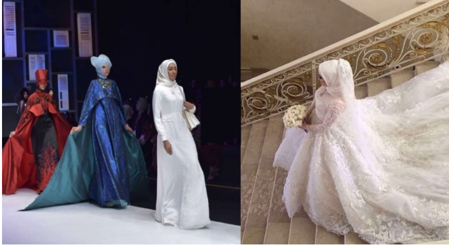
الألبسة الإسلامية للنساء تفتتح عالم صناعة الأزياء تجاريا وجماليا

٣- العنصر الثالث هو الربط على صعيد القيم ما بين اللباس ووظيفته الأساسية وبين التقوى الواجبة في سائر الأحوال {يَا بَنِي آدَمَ قَدْ أَنْزَلْنَا عَلَيْكُمْ لِبَاسًا يُؤَارِي سَوْءَاتِكُمْ وَرِيشًا وَلِبَاسُ التَّقْوَى ذَلِكَ خَيْرٌ} - ٢٦ الأعراف.