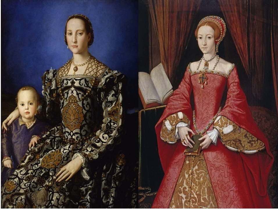
من أزياء النساء في أوروبا في القرن الميلادي ١٦

وفي عصر التنوير الأوروبي الأول (١٤٤٩-١٥٢٥م)، ظهرت الأزياء الفضفاضة وبدأت تميل خلاله إلى الألوان المزركشة، وانتشرت على المستوى الشعبي، ولكن بقي لعامل الثراء مفعوله في التمييز بين فئة وأخرى من السكان، وفي تلك الفترة أيضا بدأ يظهر الاختلاف بين ألبسة النساء والرجال تدريجيا، بما في ذلك اختيار الألوان، وأصبحت السراويل مخصصة للرجال بينما امتنعت النساء عن ارتدائها وأقبلن على الفساتين والتنانير، وهو ما بقي سائدا إلى أواسط القرن الميلادي العشرين.